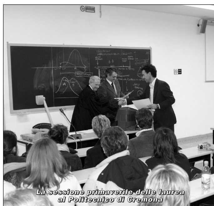
La sessione primaverile delle lauree al Politecnico di Cremona